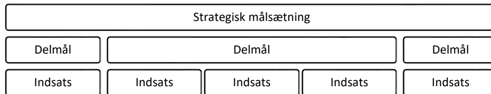
Figur 0: For hvert område er der formuleret en strategisk målsætning, der er strukturerende for delmål og indsatser. De strategiske målsætninger er tænkt som en ramme for planlægning i mange år.

Planen er struktureret i fire områder, som hver indeholder en præsentation af en strategisk målsætning for området, udmøntet i eventuelle delmål og underliggende indsatser (Figur 0).